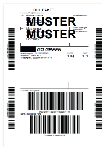
Labeldruck mit KEP-Anbindung (Beispiele mit DHL Express, UPS Standard, DHL Paket)