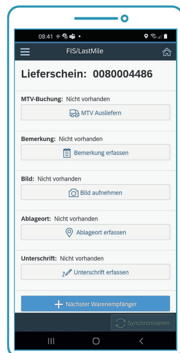
Ergonomisches Display der App FIS/LastMile

Daneben bietet die App weitere nützliche Funktionalitäten. Beispielsweise können Mehrwegtransportverpackungen (MTV) bei der Auslieferung digital verbucht und anschließend in Rechnung gestellt werden. Mit dem Tracking-Monitor für Kunden können diese einsehen, wo sich die Ware aktuell befindet. Dank